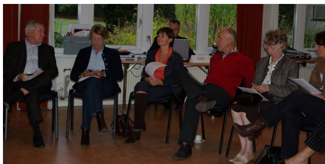
Utrechtse Commissiedag 28 september 2009 in Antropia.

De landelijke VNG wil ook in 2010 de provinciale afdelingen verder benutten als intermediair in de raadpleging van haar leden. Dat betekent dat wij er rekening mee houden dat elk van deze bijeenkomsten (mede) wordt gebruikt om een ledenraadpleging en/of –consultatie te houden.