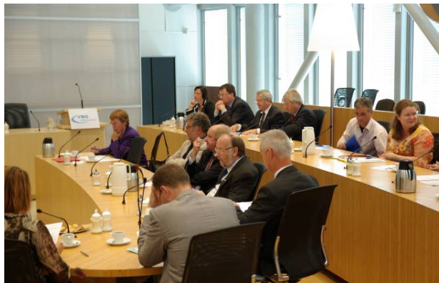
Bijeenkomst Wgr, 13 oktober 2009 in De Bilt

Zo hebben wij bijvoorbeeld ook in 2009 samen met de VNG afdelingen Gelderland en Flevoland en het Actieprogramma Lokaal Bestuur raadsledenbijeenkomsten georganiseerd over de Wet Gemeenschappelijke Regelingen.