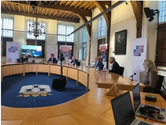
Het forum in de raadzaal van Vianen, gemeente Vijfheerenlanden

congres daarom op om ook binnen de eigen politieke partij op te komen voor de belangen van de gemeenten.