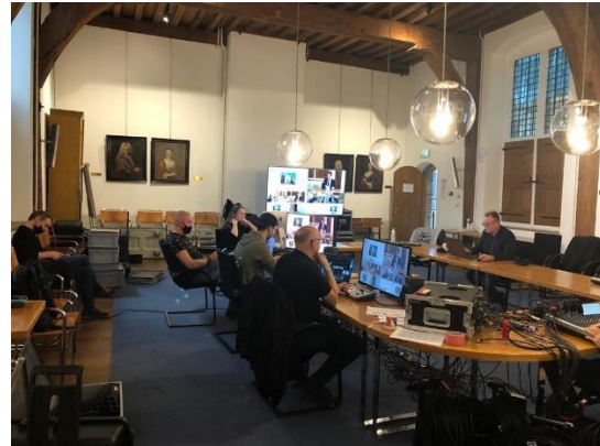
Achter de schermen