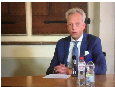
Sjors Fröhlich, burgemeester Vijfheerenlanden

Op 20 november 2020 werd het Najaarscongres 'Het Utrechts Aanbod' gehouden. Het congres werd verzorgd vanuit de raadzaal van het monumentale stadhuis te Vianen, gemeente Vijfheerenlanden.